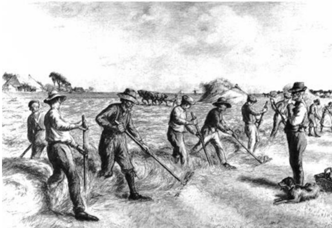
Een groep ‘hannekemaiers’ aan het werk. Alleen door vakkundige samenwerking in groepen kon een hoger loon verkregen worden.

De grasmaaiers, ook wel ‘hannekemaiers’ genoemd, werkten voor een afgesproken stukloon, wat noopte tot het werken in een hoog tempo. De grasmaaiers wilden natuurlijk zo weinig mogelijk geld voor levensmiddelen uitgeven en ook dit spoorde hen aan het werk zo snel mogelijk te klaren. Een eerste vereiste voor een grasmaaier was dat hij in samenwerkingsverband een zo groot mogelijke prestatie kon leveren. Alle grasmaaiers maaiden namelijk in hetzelfde ritme.